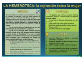
LA HEMEROTECA: LA REPRESIÓN SOBRE LA MUJER