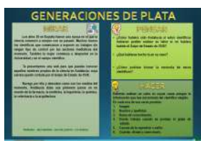
GENERACIONES DE PLATA formato Presentación y pdf