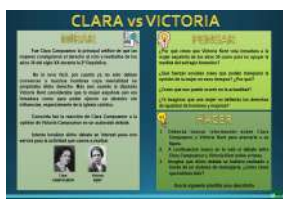
CLARA vs VICTORIA formato Presentación y pdf