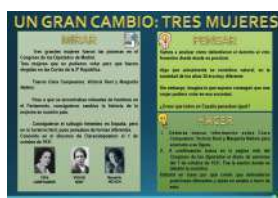
UN GRAN CAMBIO formato Presentación y pdf