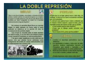
LA DOBLE REPRESIÓN formato Presentación y pdf