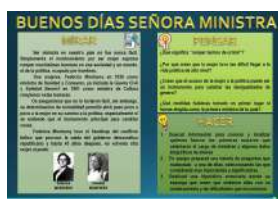
BUENOS DÍAS SEÑORA MINISTRA formato Presentación y pdf