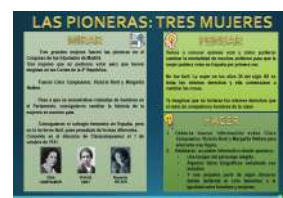
LAS PIONERAS formato Presentación y pdf