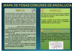
MAPA DE FOSAS COMUNES formato Presentación y pdf