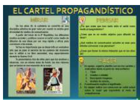
EL CARTEL PROPAGANDÍSTICO formato Presentación y pdf