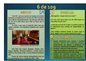
6 DE 109 formato Presentación y pdf